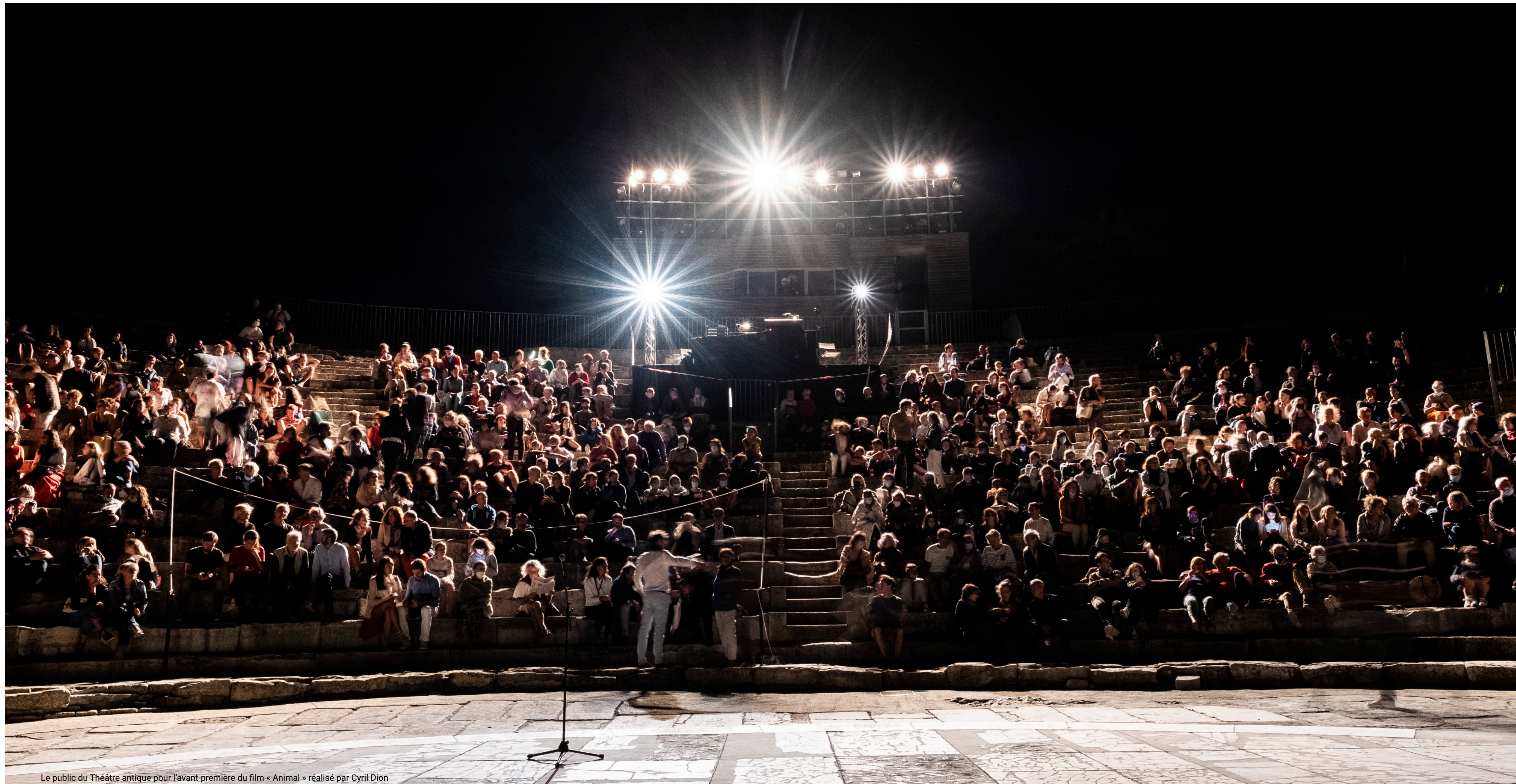
Le public du Théâtre antique pour l'avant-première du film « Animal » réalisé par Cyril Dion