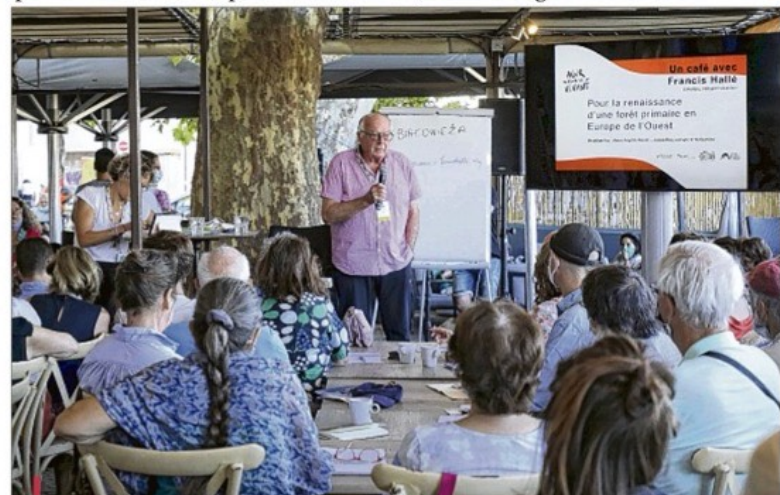
À la fraîche, tous les matins à 9h, en rendez-vous sur la thématique du jour, pour un café, avant des conférences, des soirées.

En 2015 le film documentaire Demain , réalisé par Cyril Dion et Mélanie Laurent, faisait l'effet d'une bombe en montrant des initiatives dans le monde pour faire en sorte qu'il tourne mieux, plus longtemps... Or en 2021, 50 ans leur monde pourrait devenir inhospitalier. Ils ont beau aller mais rien ne change vraiment. Alors ils décident de remonter à la source du problème : la relation de chacun au monde vivant. Sous l'impulsion de la primatologue Jane Goodall, tout au long d'un exténuant voyage, ils vont comprendre que l'homme est profondément lié à toutes les autres espèces. Et qu'en les sauvant, il se sauvera aussi. L'être humain a cru qu'il pouvait se séparer de la nature, mais c'est la nature, il est, lui aussi, un animal.