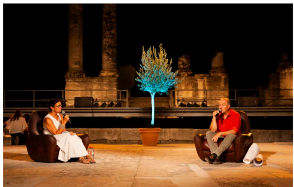
par Fabienne Arvers Publié le 26 août 2021 à 17h36 Mis à jour le 26 août 2021 à 17h48

Felwine Sarr, au festival Agir pour le vivant : « Nous vivons à l'époque d'un écocide »