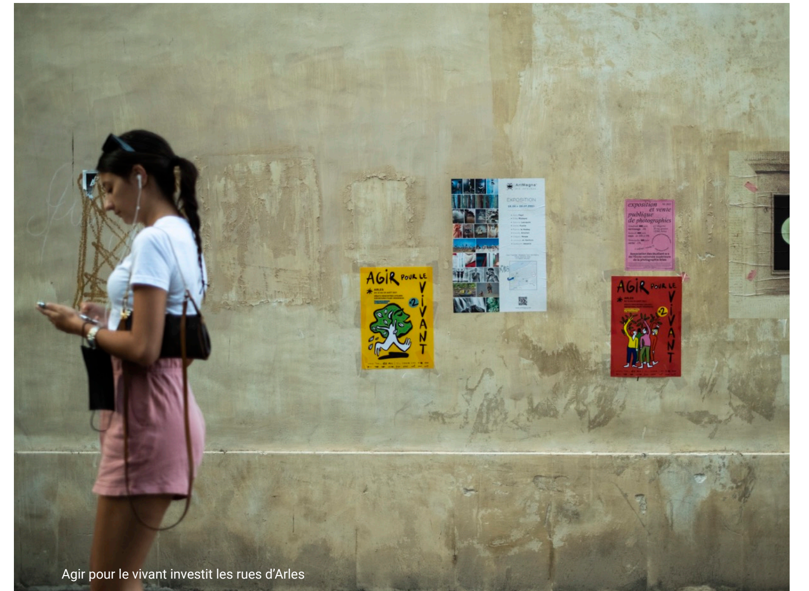
Agir pour le vivant investit les rues d'Arles