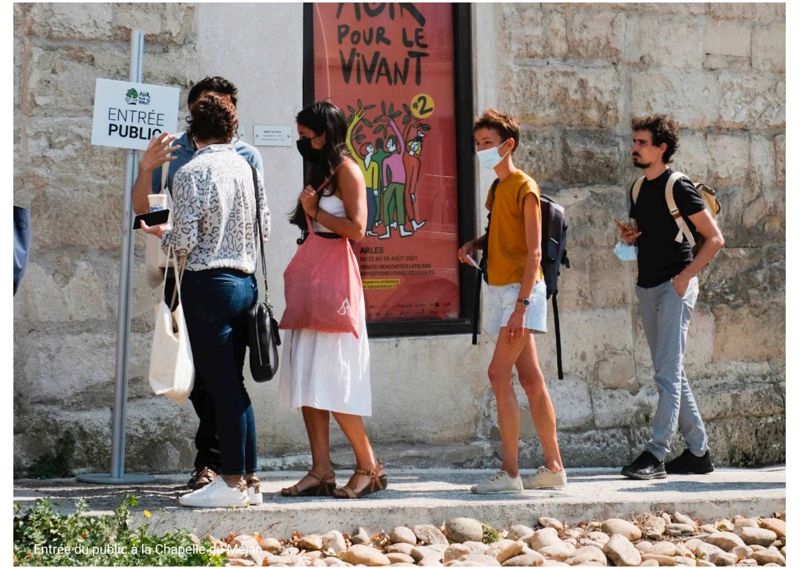
Entrée du public à la Chapelle de Mejan