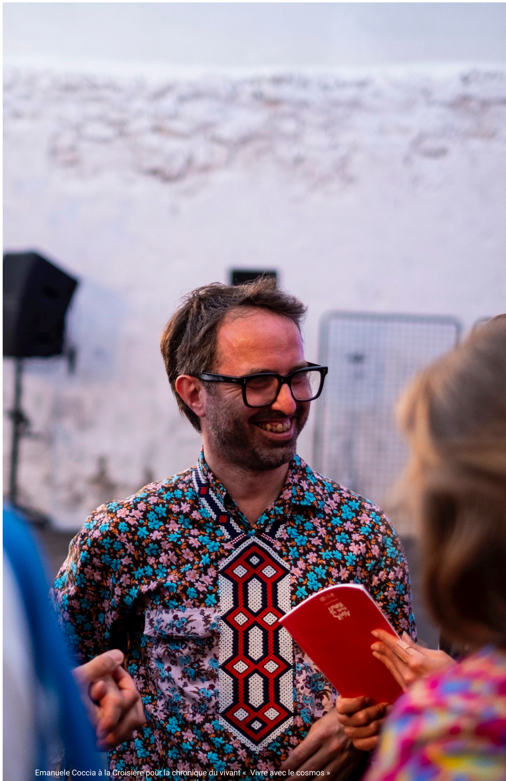
Emanuele Coccia à la Croisière pour la chronique du vivant « Vivre avec le cosmos »