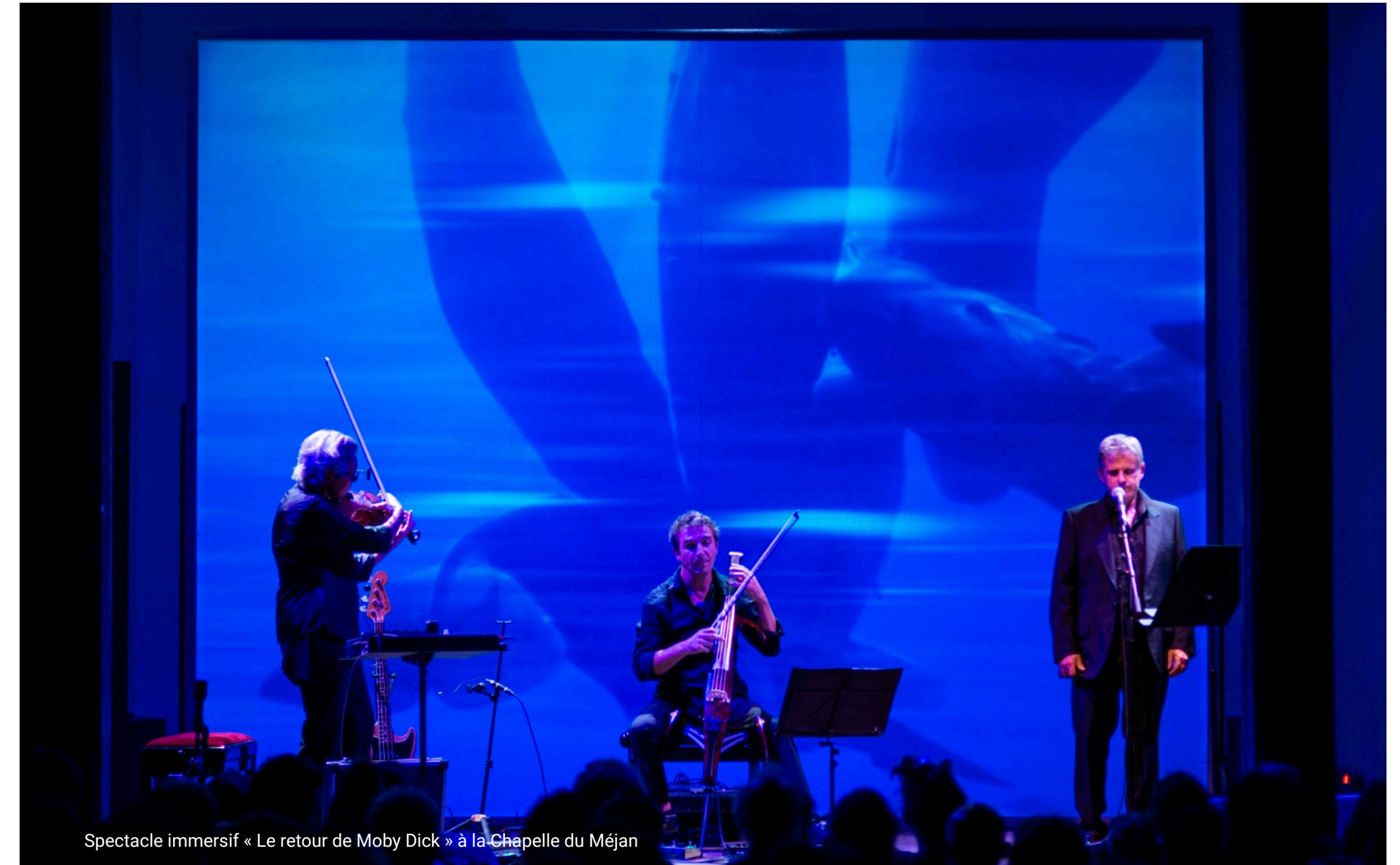
Spectacle immersif « Le retour de Moby Dick » à la Chapelle du Méjan