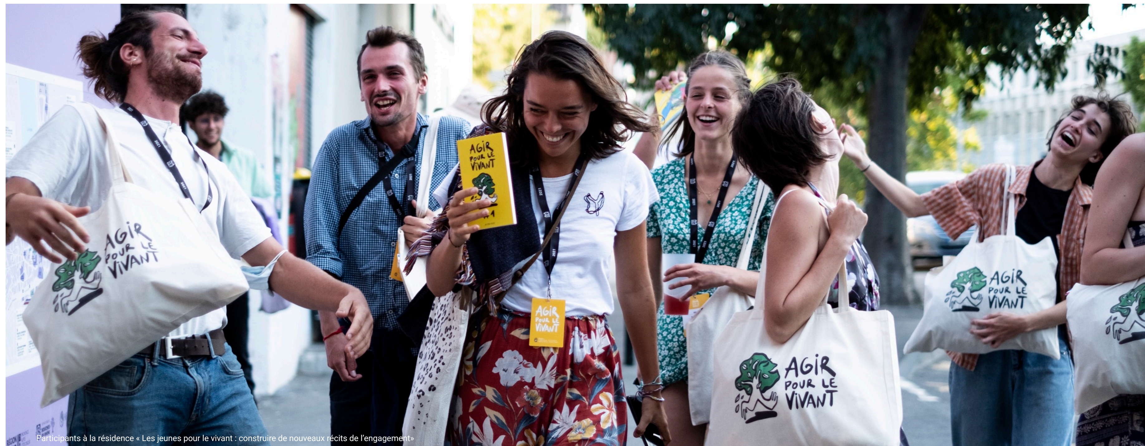
Participants à la résidence « Les jeunes pour le vivant : construire de nouveaux récits de l'engagement »