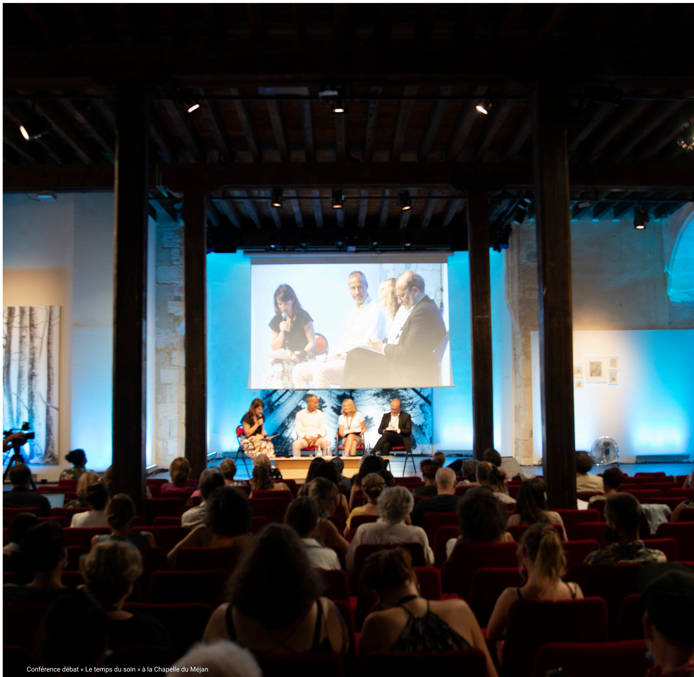
Conférence débat « Le temps du soin » à la Chapelle du Méjan