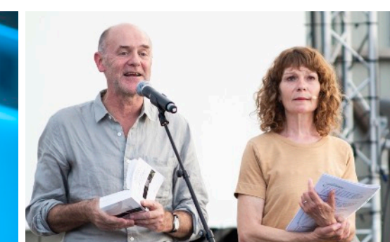
Jacques Bonnafé et Agnès Sourdilhon