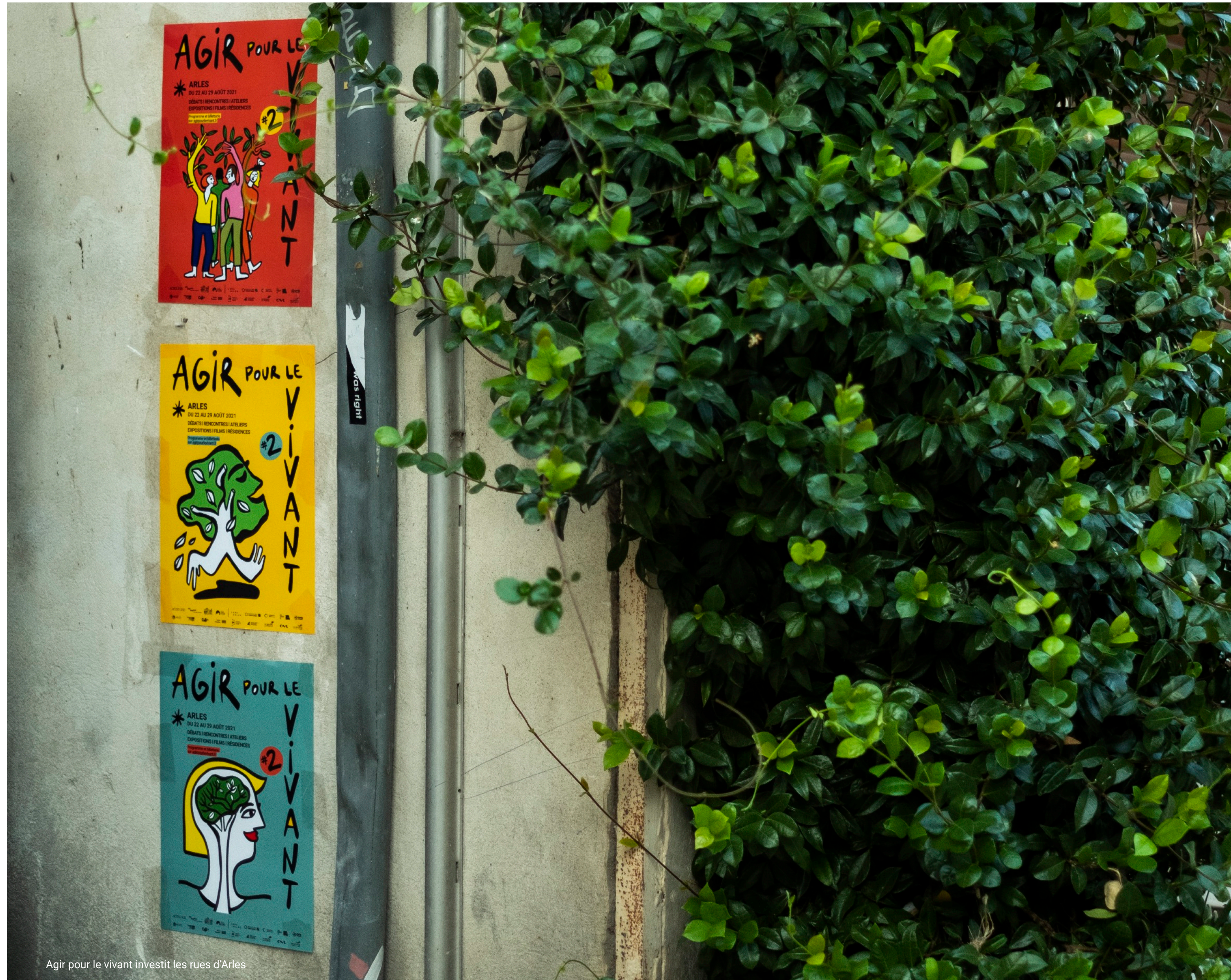
Agir pour le vivant investit les rues d'Arles