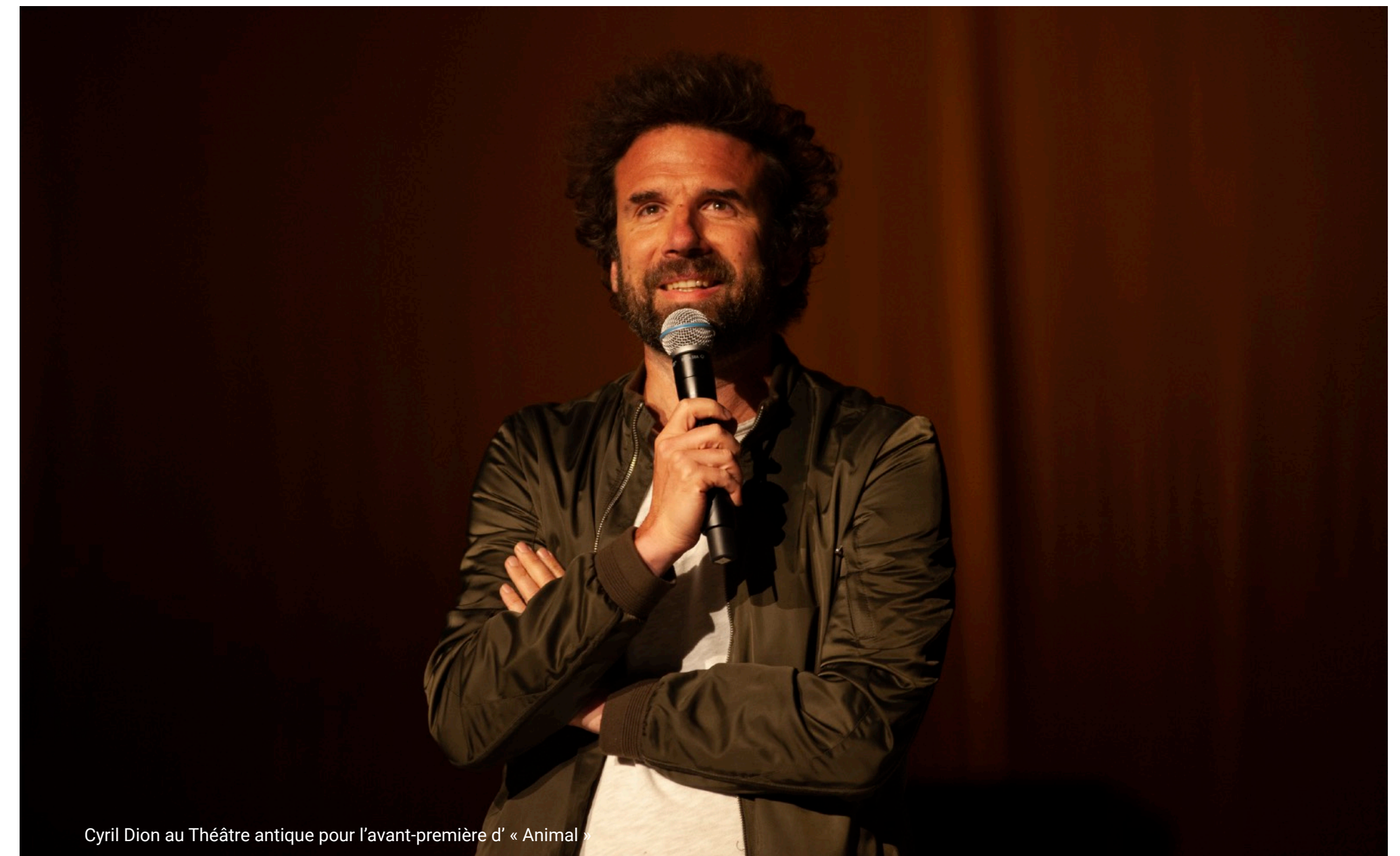
Cyril Dion au Théâtre antique pour l'avant-première d'« Animal »