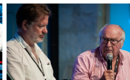
Alexis Jenni et Francis Hallé